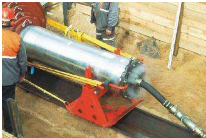
Фото сверху: TERRA-RAMMEN TR 565 забивает трубу \varnothing 1400 мм.