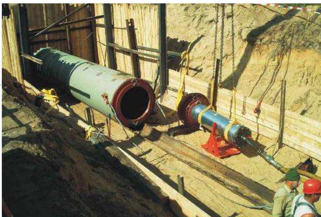
Фото справа: TERRA-RAMMEN TR 565 перед присоединением к стальной трубе.