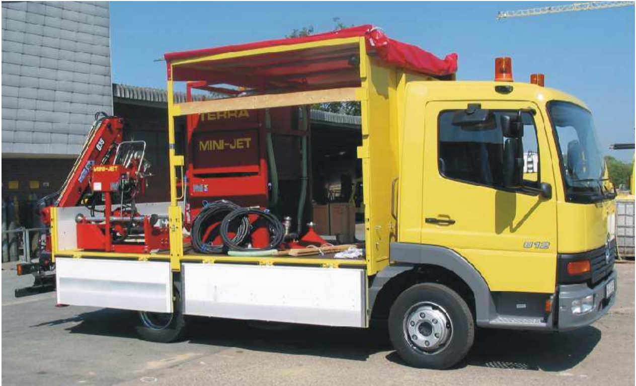
Фото сверху: Этот грузовик специально разработан компанией "M/s Rode Rohrleitungsbau GmbH & Co" для транспортировки TERRA MINI-JET. На борту полностью помещается установка ГНБ с комплектующими, а также подъемный кран и специальные инструменты.