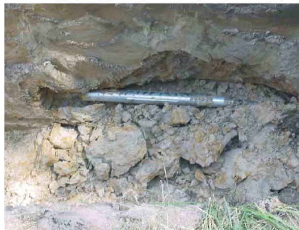
Фото внизу слева: Расширитель и новая ПЭ труба показали в стартовом котловане. Теперь они будут затянуты в лафет и демонтированы.