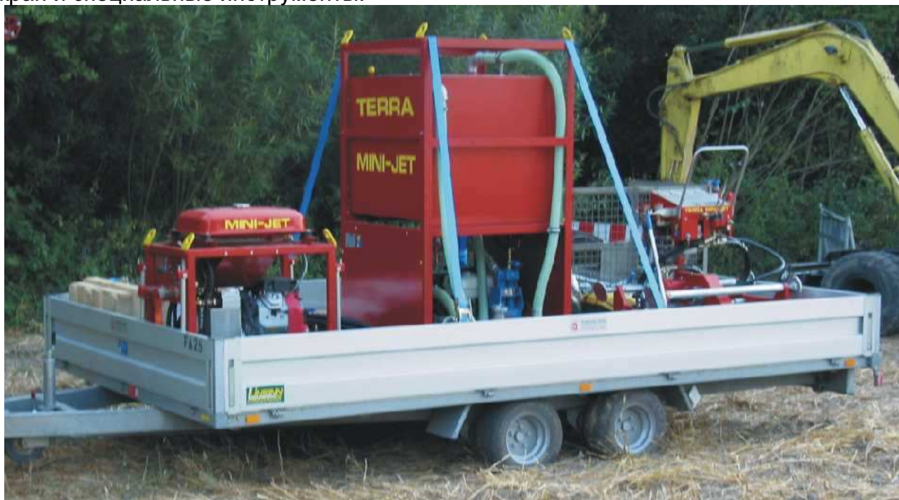
Фото внизу: Установка ГНБ TERRA MINI-JET может быть погружена на такой вот трейлер. Во время бурения и расширения грузовик может использоваться для других целей.

Фото сверху: Этот грузовик специально разработан компанией "M/s Rode Rohrleitungsbau GmbH & Co" для транспортировки TERRA MINI-JET. На борту полностью помещается установка ГНБ с комплектующими, а также подъемный кран и специальные инструменты.