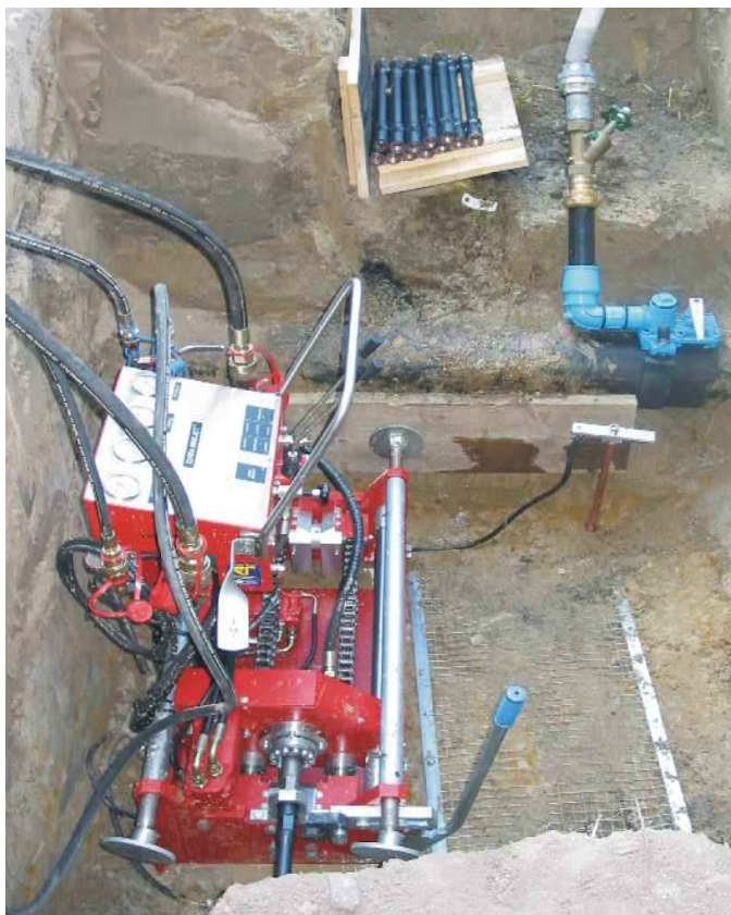
Фото слева: TERRA MINI-JET, установленная в рабочем котловане, готова началу бурения.