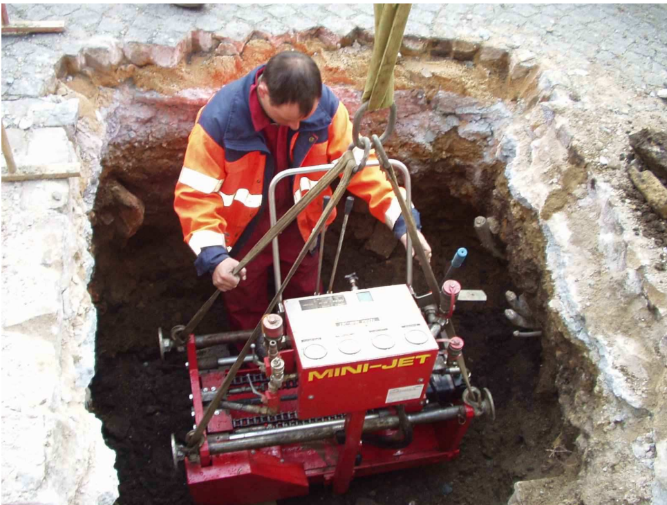
Фото слева: устанавливается в стартовый котлован.