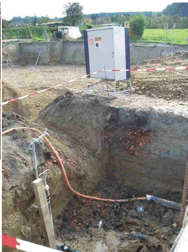
Фото справа: Сразу после протяжки первых трех труб в стартовом котловане были подведено временное электро- и водоснабжение.