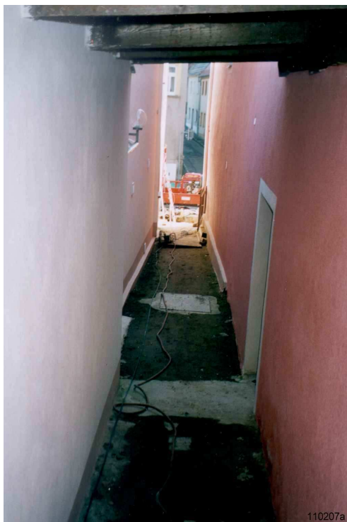
Фото слева: Буровая трасса проходит между этими жилыми домами. Пилотное бурение было завершено через 45 минут.