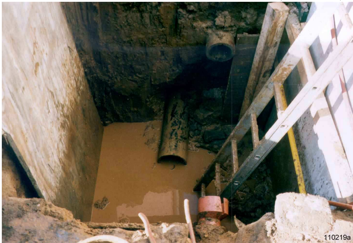
Фото сверху: ПЭ труба Ø 225 мм и длиной 19 м протянута всего за 2 часа.